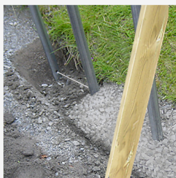
Ett 6 mm armeringsjärn träs genom de nedre hålen i stativören och betongfundamentet gjuts. Gruppen stöts så att den står rakt tills gjutningen har torkat.