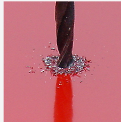
...och hålen borrar med låga varvtal. Hålen rengörs och borkax avlägsnas.