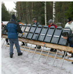
Den färdigmonterade postlådegruppen lyfts ner i installationsdiken.