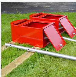
Postlådegruppens delar monteras nära installationsplatsen...