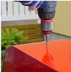
...och borrar upp med låga varvtal.