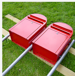
...och delarna fästs i varandra.