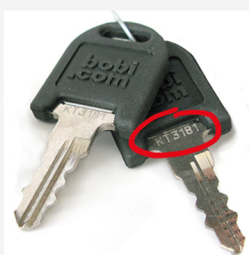
Det är bra att notera serienumren på låsen.