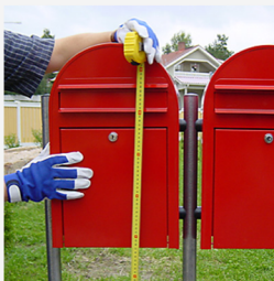
Innan gjutningen säkerställs rätt höjd och att gruppen är rak.