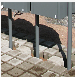
... snart färdigt...