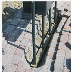
En tryckimpregnerad träbräda under stativören kan underlätta monteringen av gruppen i ett rakt läge.