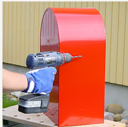
På sidoväggarna av postlådan finns färdiga markeringar för fasthål.

Obs! Innan monteringsarbetet påbörjas, säkerställ att platsen är exakt där den ska vara.