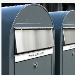
Det är bra att komplettera postlådorna med tydliga namnskytlor.